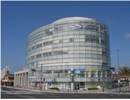
(パーティセと概観写真)

パーティセとは、尾張瀬戸駅地区第二種市街地再開発事業によって建設され、瀬戸市をはじめ7名の区分所有ビルである。