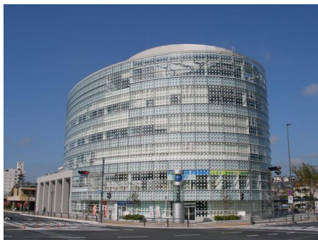
(パーティセと概観写真)

パーティセとは、尾張瀬戸駅地区第二種市街地再開発事業によって建設され、瀬戸市をはじめ7名の区分所有ビルである。